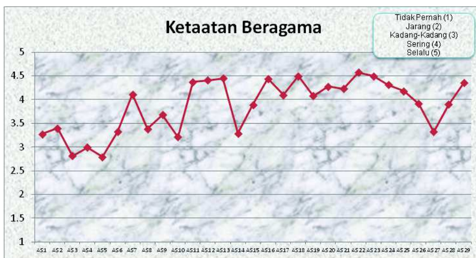
Diagram2. Uji deskriptif Ketaatan Beragama