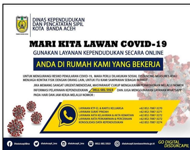
Gambar 4. Informasi WA

Taufiqul Hadi yang menyatakan bahwa sosialisasi dari e-antre disosialisasikan, akan tetapi model sosialisasinya hanya melalui website dan standing information di Disdukcapil.