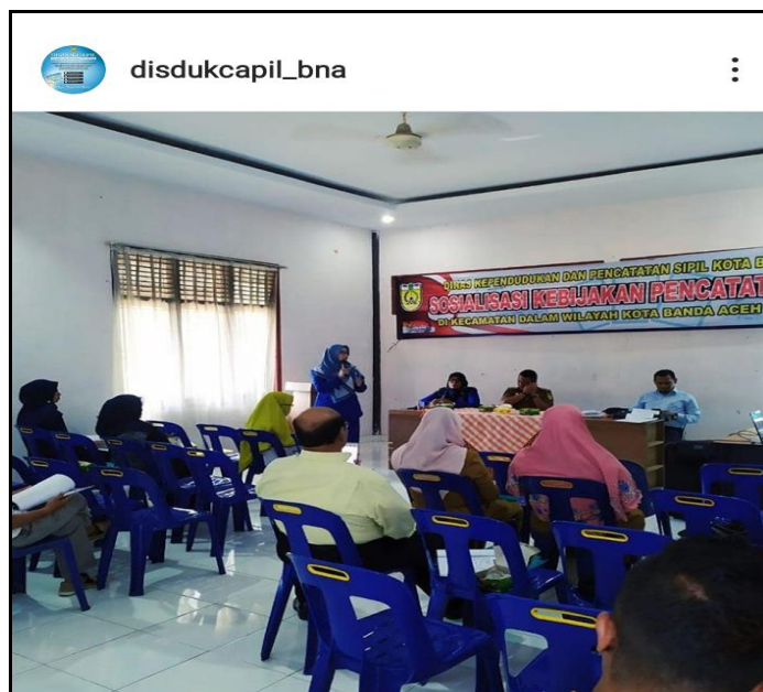
Gambar 3. Kegiatan Sosialisasi